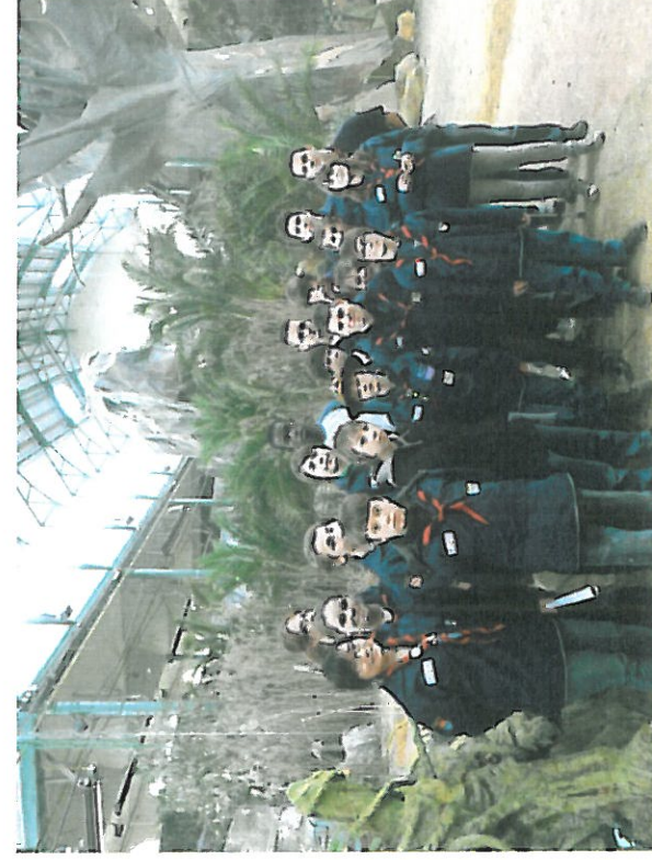
Les éclés à l'exposition des mondes perdus

Durant trois jours, ils ont construit un bateau pirate pour les activités de croq nature, de cet été, mais également fait de jeux, des veillées sous un temps pas très clément, à cause du froid et de la pluie. Les plus grands ont également participé au stage woodcraft à la fin des vacances.